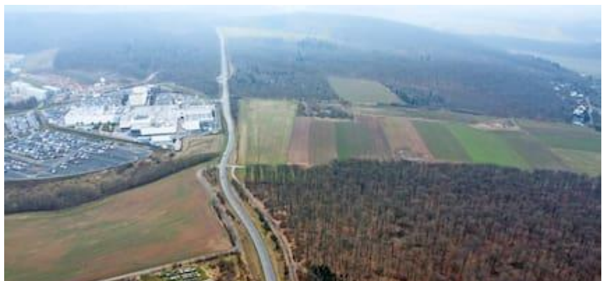
Ackerflächen gegenüber dem GSK-Produktionssitz sind 24 Hektar groß und reichen bis kurz vor Dagobertshausen. Dort könnte „Görzhäuser Hof IV“ entstehen.

Und gleichzeitig setzt die Stadt, vorneweg der Oberbürgermeister, auf einen weiteren Wachstumskurs. Neben dem Hasenkopf gibt es mit dem geplanten Gewerbegebiet Görzhäuser Hof IV ein weiteres Projekt, gegen das die Ortsgruppe Marburg Stellung bezieht.